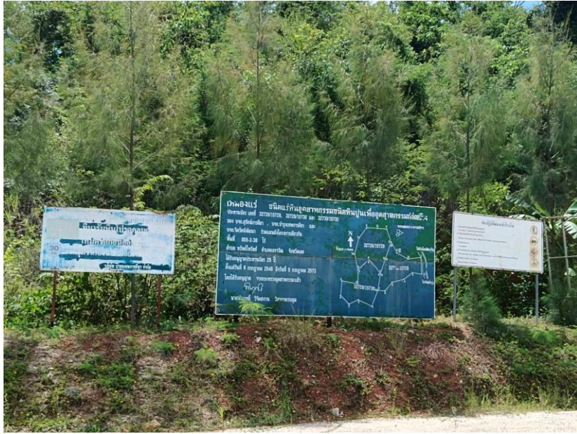
รูปที่ 1-8 ป้ายแสดงขอบเขตประทานบัตรที่ได้รับอนุญาต