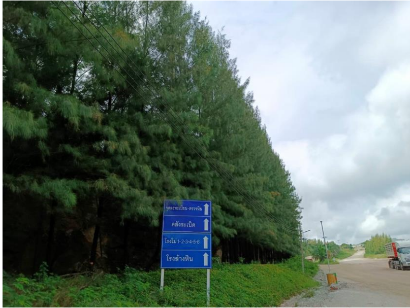
รูปที่ 1-6 ปลุกต้นสนประดิพัทธ์ เพื่อเป็นแนวป้องกันฝุ่น ตามขอบเขตของโครงการฯ