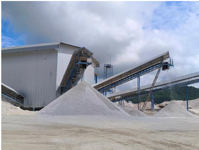
รูปที่ 1-9 โรงโม่ บดหรือย่อยหิน บริษัท บำรุงเทพการศิลา จำกัด