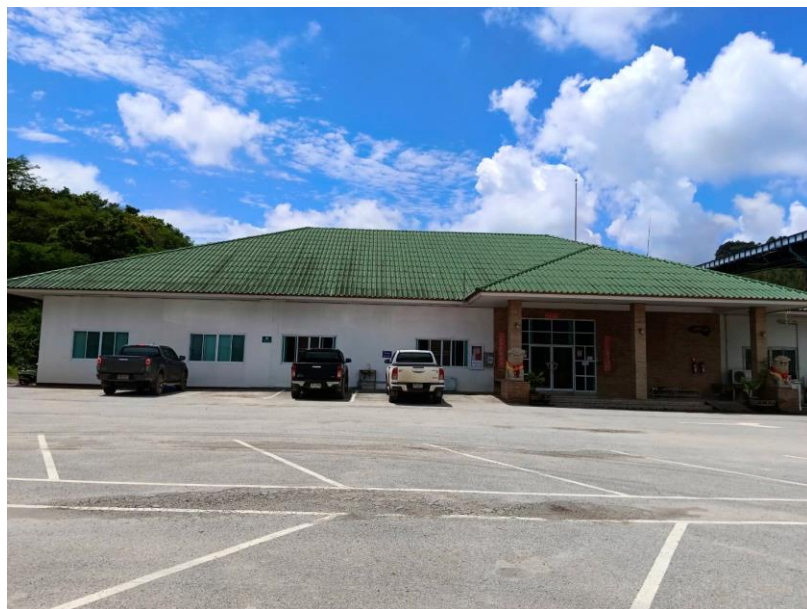
รูปที่ 1-7 อาคารสำนักงาน ที่ตั้งสำนักงาน บริษัท บำรุงเทพการศิลา จำกัด