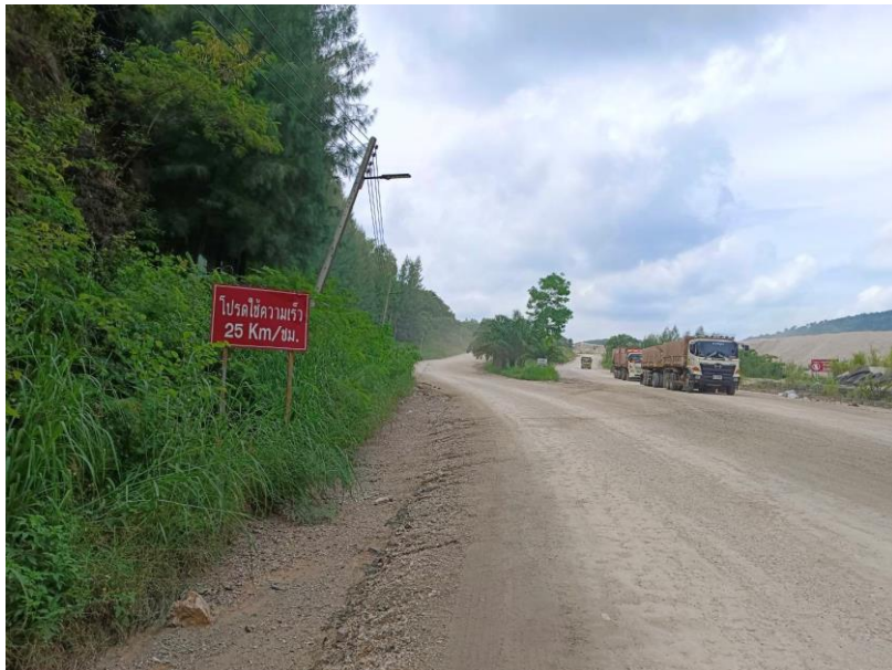
รูปที่ 1-11 เส้นทางขนส่งสินค้าภายในพื้นที่โครงการฯ