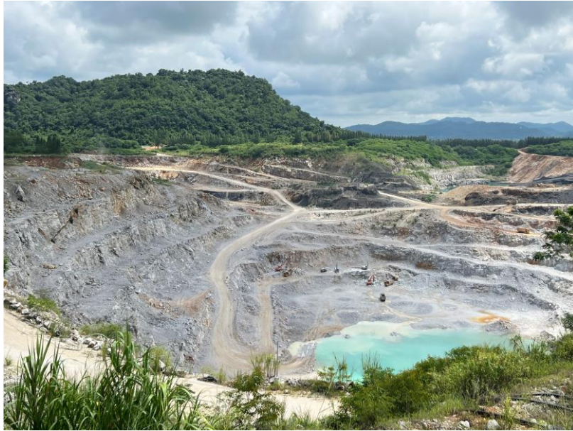
รูปที่ 1-10 หน้าเหมืองในปัจจุบัน ของโครงการฯ